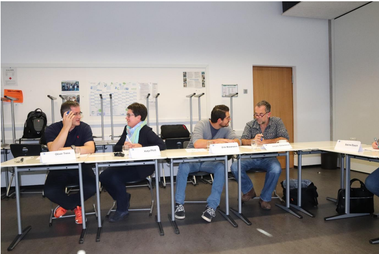
Foto 3: Die jeweiligen Schulen erarbeiten in Partnerarbeit die vorgegebenen Workshop-Inhalte Im Anschluss präsentierten die teilnehmenden Schulen ihre Ziele und mögliche Maßnahmen zur Umsetzung (s. Foto 4).