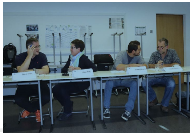
Die jeweiligen Schulen erarbeiten in Partnerarbeit die vorgegebenen Workshop-Inhalte